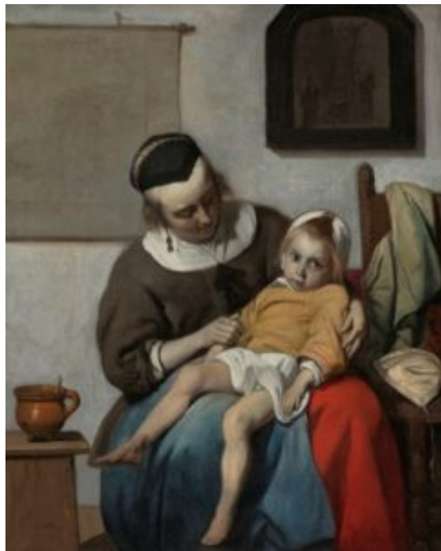
Gabriël Metsu, Het Zieke Kind, ca. 1664 - ca. 1666. Olieverf op doek, h 32,2cm × b 27,2cm. Rijksmuseum .

Nadat premier Rutte op 13 en 15 maart vergaande maatregelen afkondigde om de covid-19 epidemie beter te kunnen beheersen, stelden meerdere mensen mij als medisch historicus de vraag 'hoe we dat dan vroeger deden'. Waarmee men bedoelde: hoe gingen mensen, in Nederland en daarbuiten, in het verleden om met epidemieën van luchtweginfecties? Het korte antwoord is: heel anders. Met het lange antwoord zou ik een boek kunnen vullen, maar een blog post (of twee) is sneller geschreven en leest makkelijker. Deze week deel 1, over de geschiedenis van het begrip van luchtwegaandoeningen. Over enkele dagen deel 2, over de geschiedenis van de behandeling en beheersing van luchtwegaandoeningen.