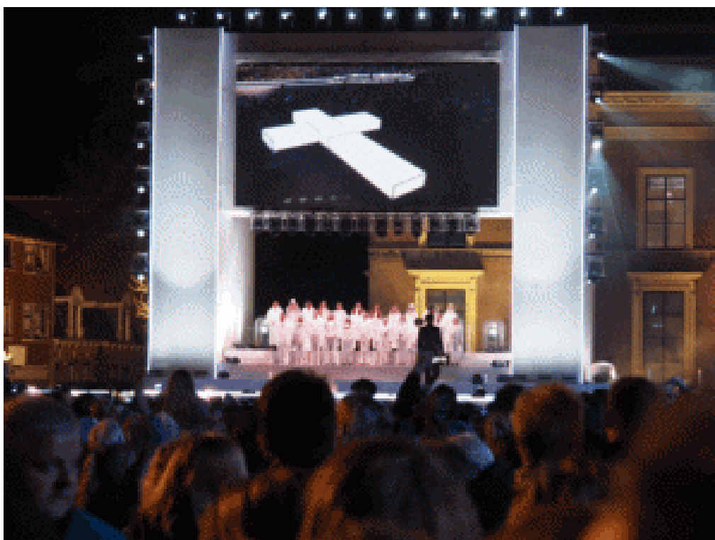
The Passion, foto gemaakt door de auteur