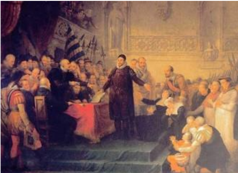
Afbeelding 5. Willem I prins van Oranje vraagt aan Hembyze en andere Gentse Calvinisten de opgesloten katholieken vrij te laten (1819) door Mattheus Ignatius van Bree (coll. Stadhuis van Gent).