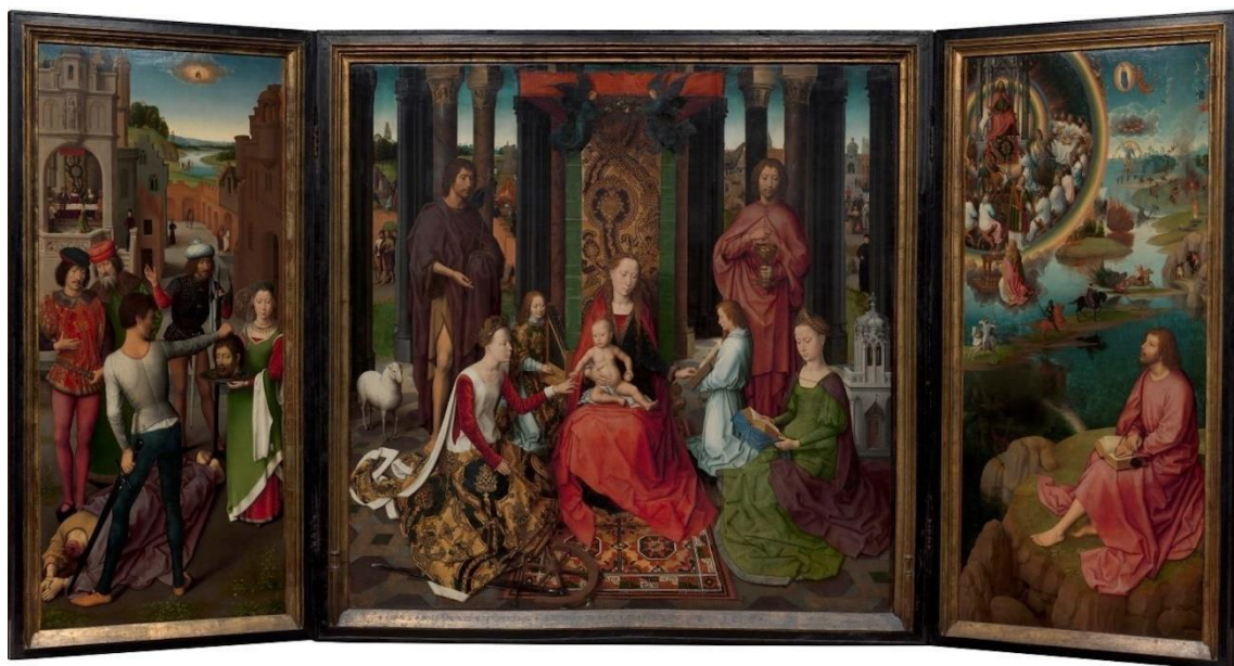
Afbeelding 8. Drieluik van Johannes de Doper en Johannes de Evangelist (1479) door Hans Memling (Groeningemuseum, Brugge).