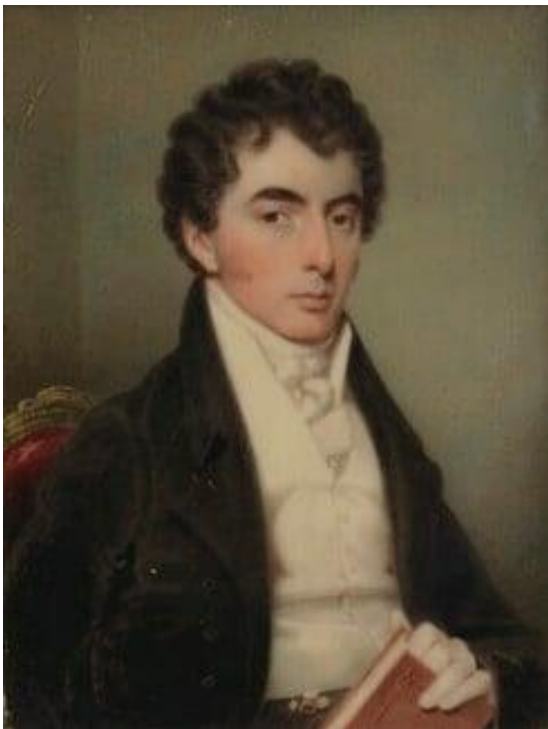
Afb. 1. E. Nash, portret van Robert Southey, 1820 (coll. National Portrait Gallery).