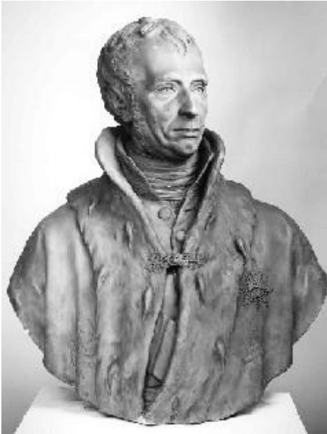
Afbeelding 4. Willem I, koning der Nederlanden (1815) door Gilles Lambert Godecharle.