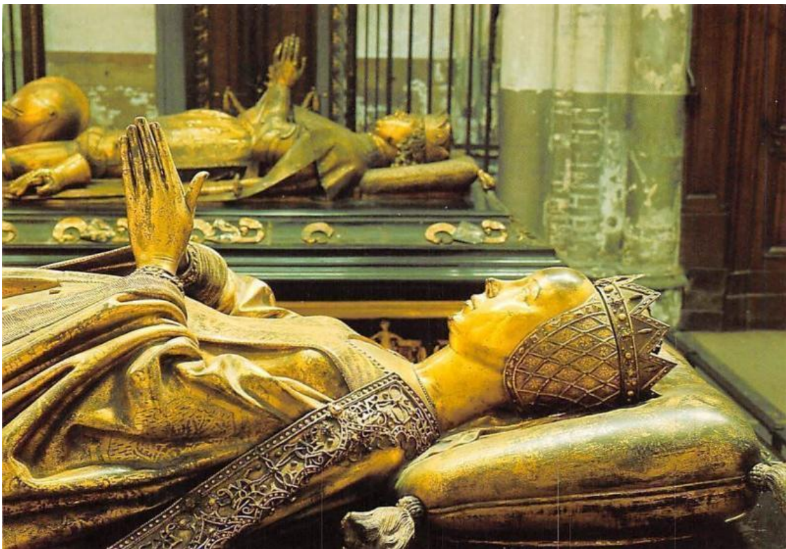
Afbeelding 11. Praalgraven van Maria van Bourgondië (1457-1482) en Karel de Stoute (1433-1477) (1563) door Jan de Smet, Judocus Aerts, Cornelis Floris de Vriendt en Jacob Jonghelinck (Onze-Lieve-Vrouwekerk, Brugge).