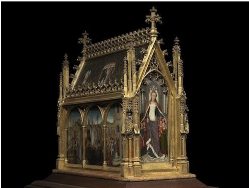
Afbeelding 6e Reliekschrijn van de Heilige Ursula (1482-1489) door Hans Memling (Groeningemuseum, Brugge).