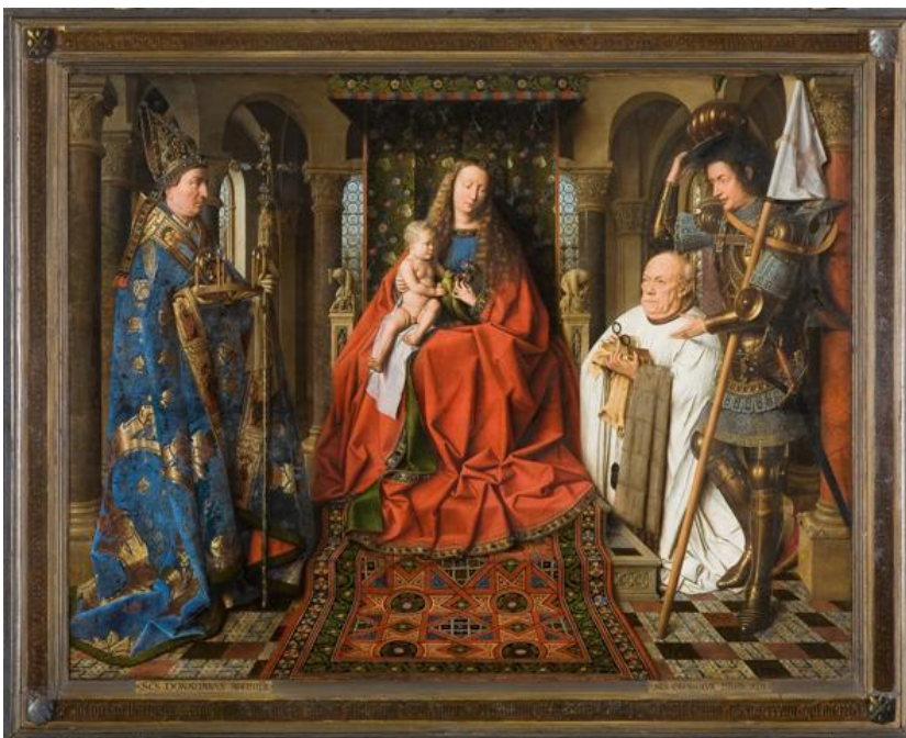
Afbeelding 10. Madonna met kanunnik Joris van der Paele (1434-1436) door Jan van Eyck (coll. Groeningemuseum, Brugge).