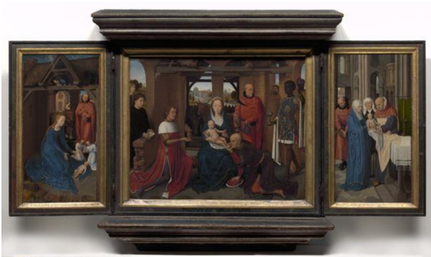
Afbeelding 7. De Aanbidding der Wijzen (1479) door Hans Memling (Groeningemuseum, Brugge).